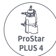
ProStar PLUS 4